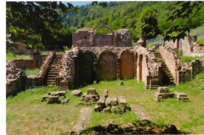
Vervolgens naar de ruïne van Niedermünster. (het eerste hospitaal in Europa)