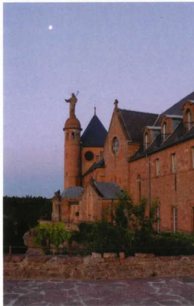
Dag 1 Mont St.Odile

Op deze wijze plaveide Odilia de weg voor Parzival, die in het zelfde Ettichonengeslacht 150 jaar later werd geboren. Hij bracht zijn jongensjaren samen met zijn moeder door in de bossen van Sol-tane. Het is tevens de plek waar Odilia haar inwijding doormaakte.